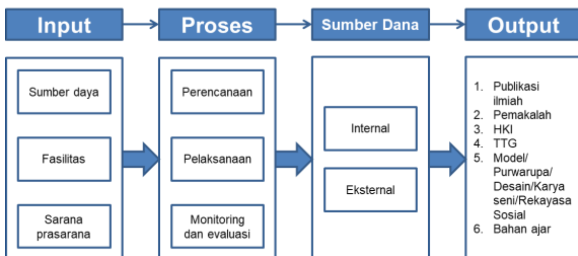
Gambar 3.1 Peta Strategi Pengembangan Unit Kerja

Secara garis besar peta strategi implementasi Renstra Penelitian STIA Pembangunan Jember disajikan pada Gambar 3.1 berikut.